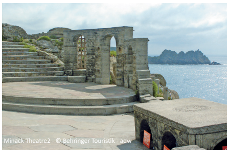
Minack Theatre2

erster längerer Aufenthalt wird in Salisbury sein. Falls Sie jemals von einem friedlichen Städtchen an den Gestaden eines Flusses inmitten der grünen englischen Landschaft geträumt haben, dann finden Sie es hier. Salisbury, Hauptstadt der Grafschaft Wiltshire, ist seinerzeit durch den Wollhandel zu Wohlstand gelangt. Hier strahlt alles heitere Ruhe aus: Die Cottages mit ihrem Fachwerk, die Häuser aus Backsteinen und Kieselsteinen, die historischen Pubs und Inns, das leise Geplätscher des Avon und die ehrwürdigen Bäume des Old Sarum. Nicht weit entfernt von Salisbury befindet sich ein weiterer berühmter Ort. Wir sehen das bedeutendste Monument der Prähistorie – den ca. 5.000 Jahre alten Steinkreis von Stonehenge. Unklar ist immer noch, welcher okkulte Brauch hier im Schatten des mystischen Steinkreises zelebriert und was mit ihm bezweckt wurde. Nach einer Besichtigung fahren wir weiter in die berühmte Hafenstadt Plymouth, unseren nächsten Übernachtungsort.