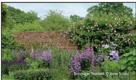
Behringer Touristik © Anke Schön

Anreise nach Calais. Hier geht es mit der Fähre über den Ärmelkanal nach Dover und weiter nach Ashford, wo wir unsere Reiseleitung treffen und für die nächsten beiden Nächte unser Hotel beziehen.